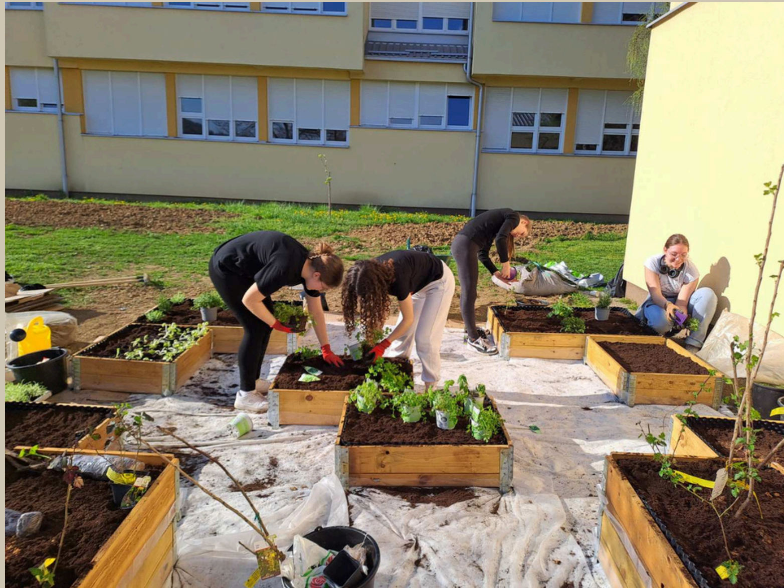
Uređivanje nasada u školskom vrtu