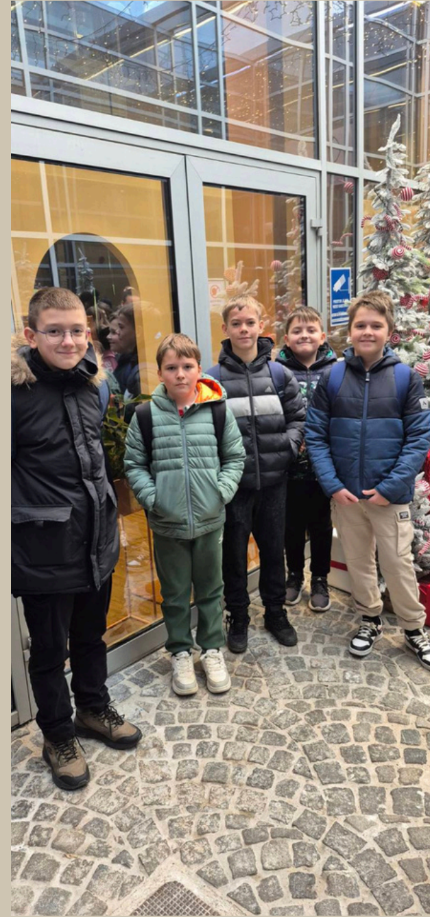
posjet poduzetnicima u Zagrebu